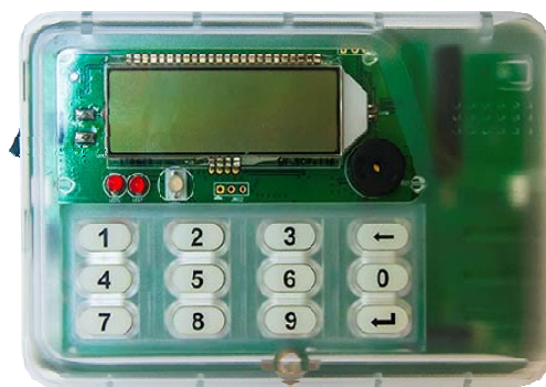
Рисунок 3 - Общий вид индикаторного устройства