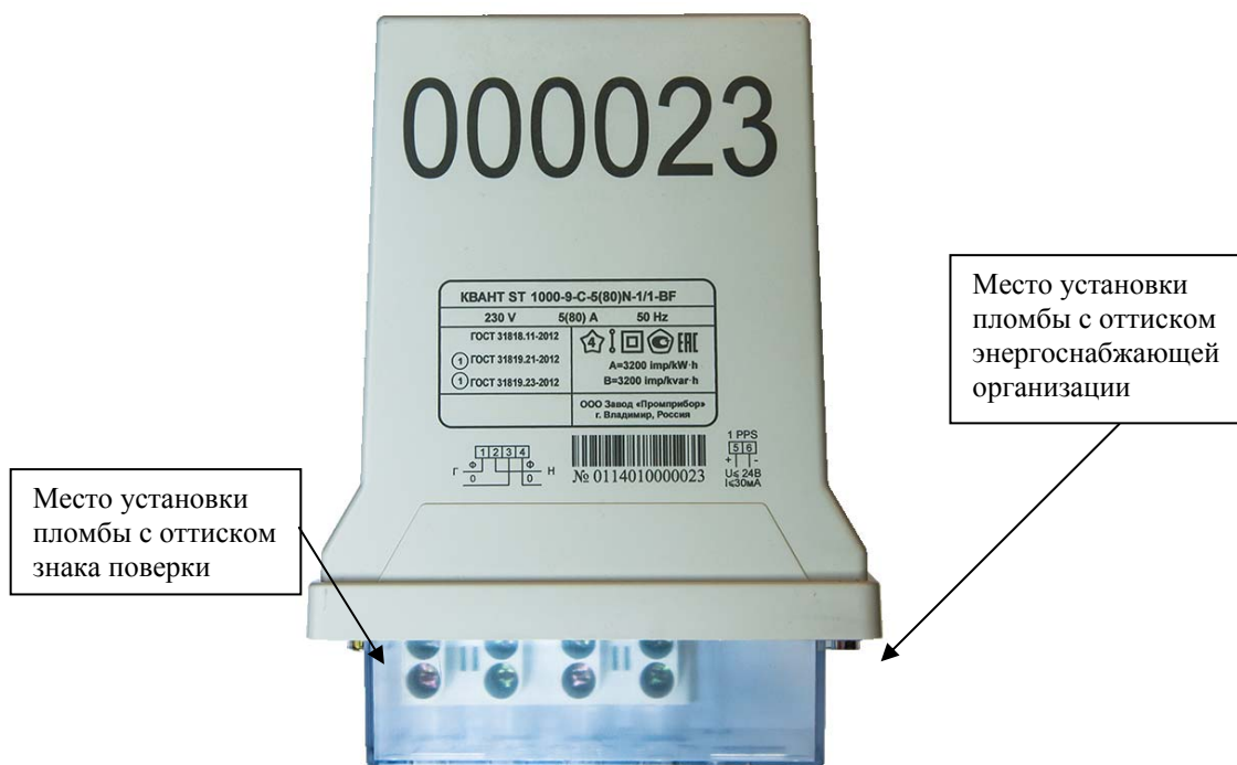
Рисунок 2 - Общий вид счетчика в корпусе типа С