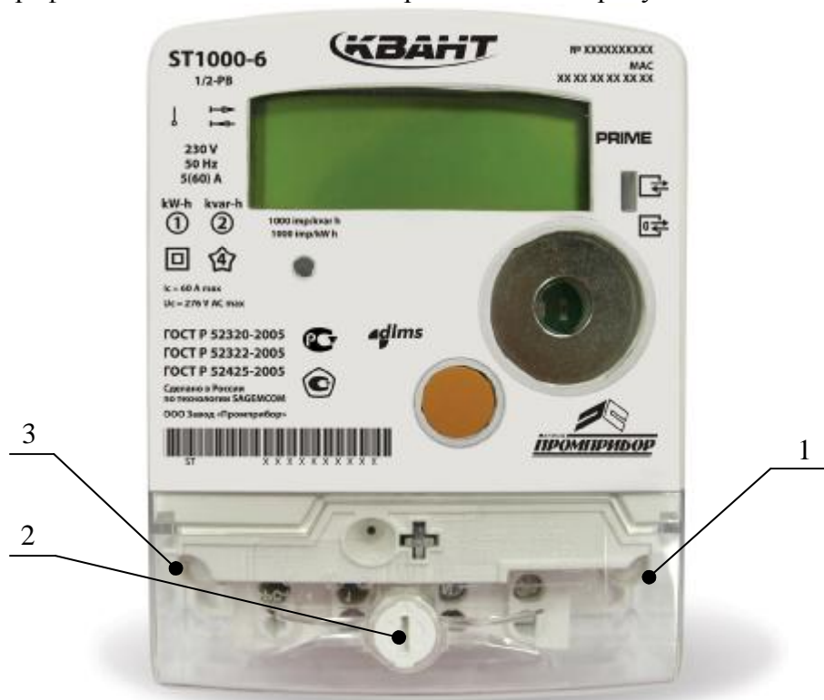
Рисунок 1 – Фотография общего вида счетчиков

Фотография общего вида счетчиков представлена на рисунке 1.